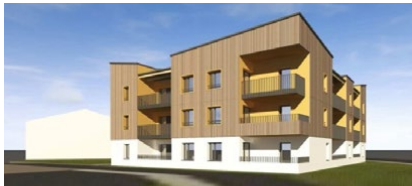
Beaupréau en Mauges - Le Clos Saint Jean 12 logements collectifs (3 T2 et 9 T3) - début des travaux prévu en décembre 2021 pour une livraison en avril 2023