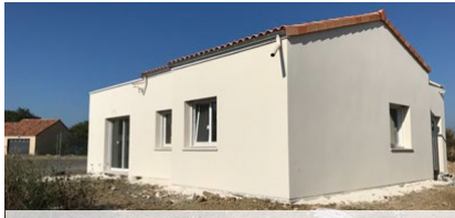
Chanteloup les Bois - Le Hameau de l'Échallier 5 logements (4 T3 et 1 T4) - livraison prévue en février 2022