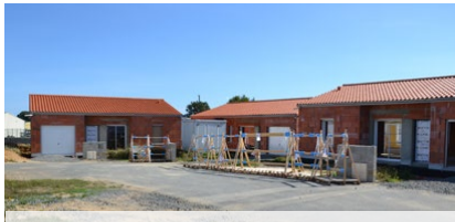
La Poitevinière - Le Gazeau 4 logements (3 T3 et 1 T4) livraison prévue en février 2022