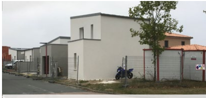
La Séguinière - Le Bordage 7 logements (5 T3 et 2 T4) livraison prévue en mars 2022