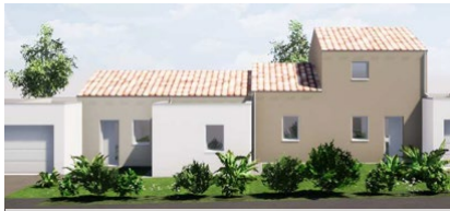
Cholet - Le Puy Saint Bonnet Lotissement Bois Chantemerle 4 logements (3 T3 et 1 T4) - début des travaux prévu en décembre 2021 pour une livraison prévue en janvier 2023